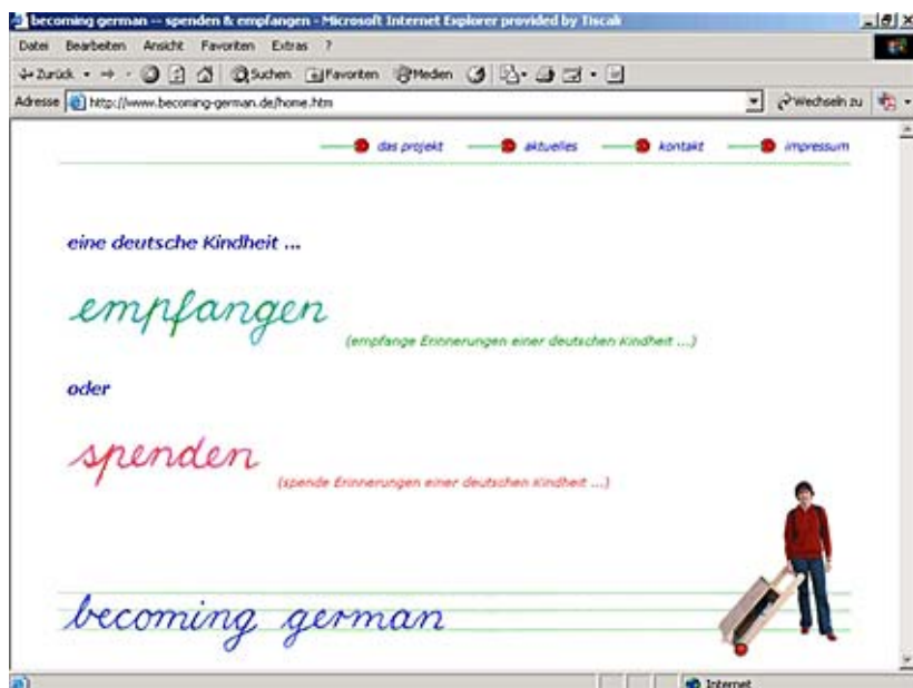
Screenshot der Internet-Datenbank "becoming german" www.becoming-german.de

Die Datenbank befindet sich im Internet unter: www.becoming-german.de