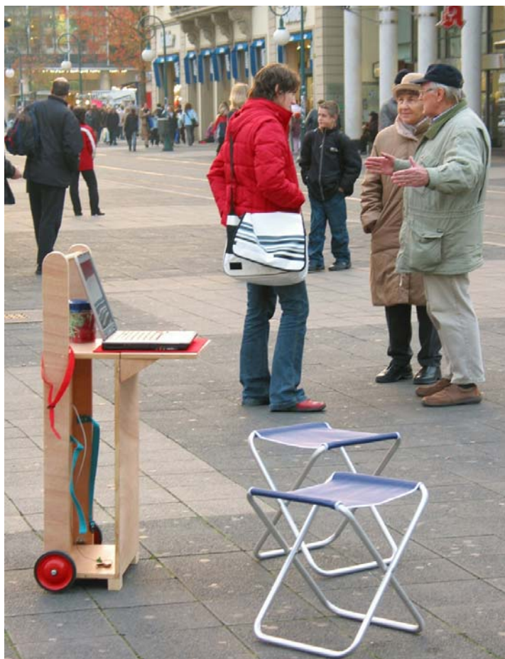
Unterwegs in der Kasseler Innenstadt, November 2004

Um über das Projekt zu informieren und vor Ort - Stadtzentren, Bahnhöfe etc. - Daten für die Datenbank zu sammeln wurde ein mobiles Info-Modul entwickelt. Dies besteht aus einem leicht transportierbaren Möbel mit ausklappbarer Tischfläche und zwei Klapphockern. Ein Laptop bietet die Möglichkeit, die Info-Website und Datenbank auf der lokalen Festplatte anzusehen und zu benutzen.