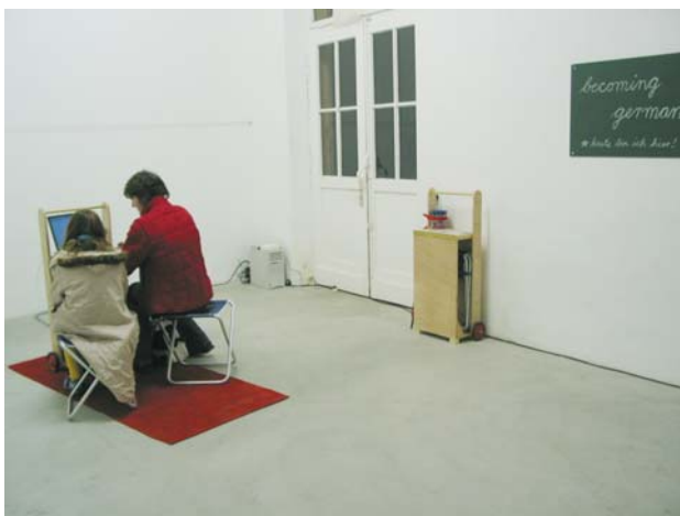
Die festinstallierte Info-Stelle im Kasseler Kulturbahnhof, November 2004

Zu festgelegten Zeiten bin ich anwesend, um das Projekt zu betreuen.