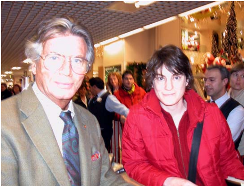
Winnetou und ich, Galeria Kaufhof, Köln, 2004

Ziel der Internet-Datenbank "becoming german" ist es, eine Informationsquelle und Hilfestellung für diejenigen zur Verfügung zu stellen, denen eine deutsche Kindheit fehlt bzw. die gerne "deutsch" werden möchten oder eine andere "deutsche Kindheit" haben wollen.