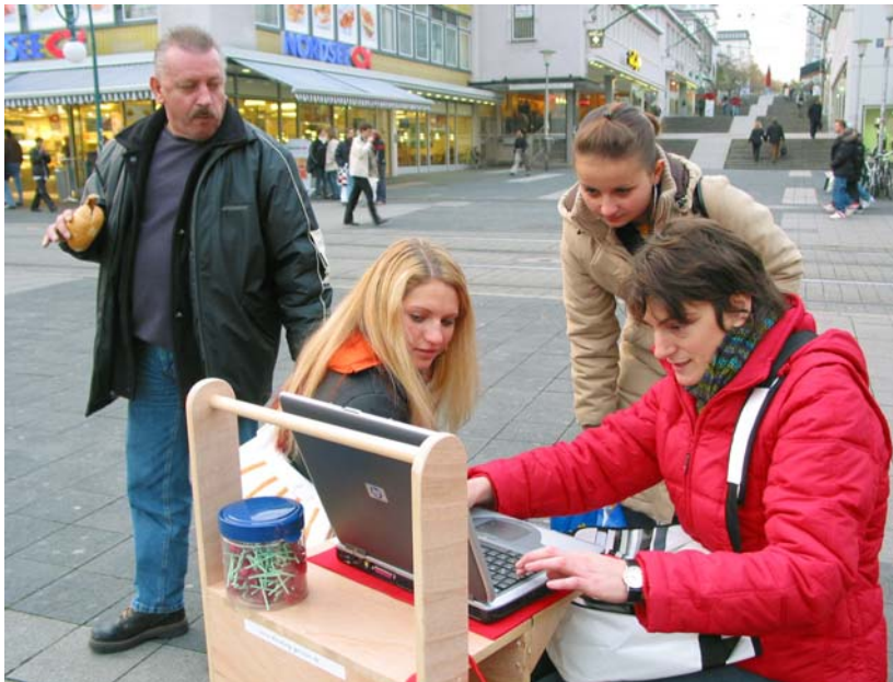
Unterwegs in der Kasseler Innenstadt, November 2004

Eine Wanderschaft mit dem mobilen Info-Modul vor Ort und der persönliche Kontakt beim Sammeln von Informationen ermöglichen einen direkten Austausch zwischen Erzähler und Zuhörer im Sinne der mündlichen Überlieferung.